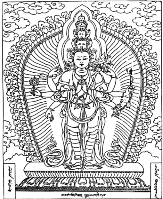
Csenrézi, az Oltalmazó, A nagy együttérzés bódhiszattvája

E „lényegre mutató, öreg mamának szánt útmutatás” elmédnek minden másnál hasznosabb.