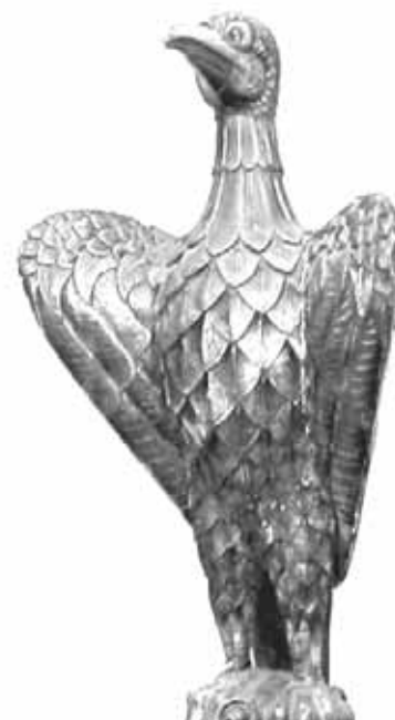
2005. Február 9. Fa madár év kezdete

December 11. szombat Decemberben hiányzik a 30. nap a tibeti naptárból, ezért előző nap tartjuk. Jan 10. hétfő Feb 8. kedd, a tibeti 2131, fa majom év utolsó napja